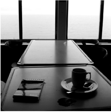
pH: 9 - a cup of coffee on a table on a boat