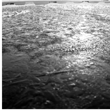
pH: 7 (a, b) - saab: (a) ice (ahead), (b): ice (roof)

Sono a metà tra Germania e Danimarca, tra gli euro e le corone, tra uno studente e qualcos'altro, tra la solitudine e la solitudine (alone-lonely), a metà tra una colazione e un pasto, tra il cielo e la terra (sono sul mare), tra il mio senso di normalità e quello degli altri, tra il freddo e il caldo, no tra il freddo e il freddissimo, tra la paura e l'intuizione legittima di poter fare bene, tra le potenzialità e le trasformazioni di queste; anche a metà tra vita e morte (ma in genere queste cose le dicono i preti, certi preti, o le zingare. A volte anche qualche cantante di san remo). A metà tra figlio e padre.